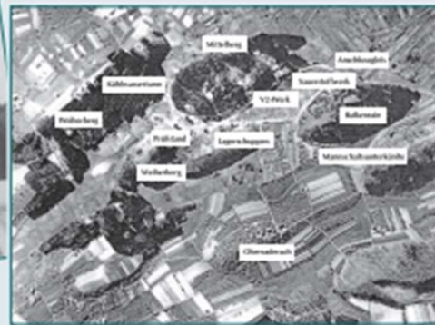
Luftaufnahme V2-Testanlage Raderach

Im 2. Weltkrieg wurde in Raderach ein Testgelände für die V2-Raketentriebwerke errichtet.